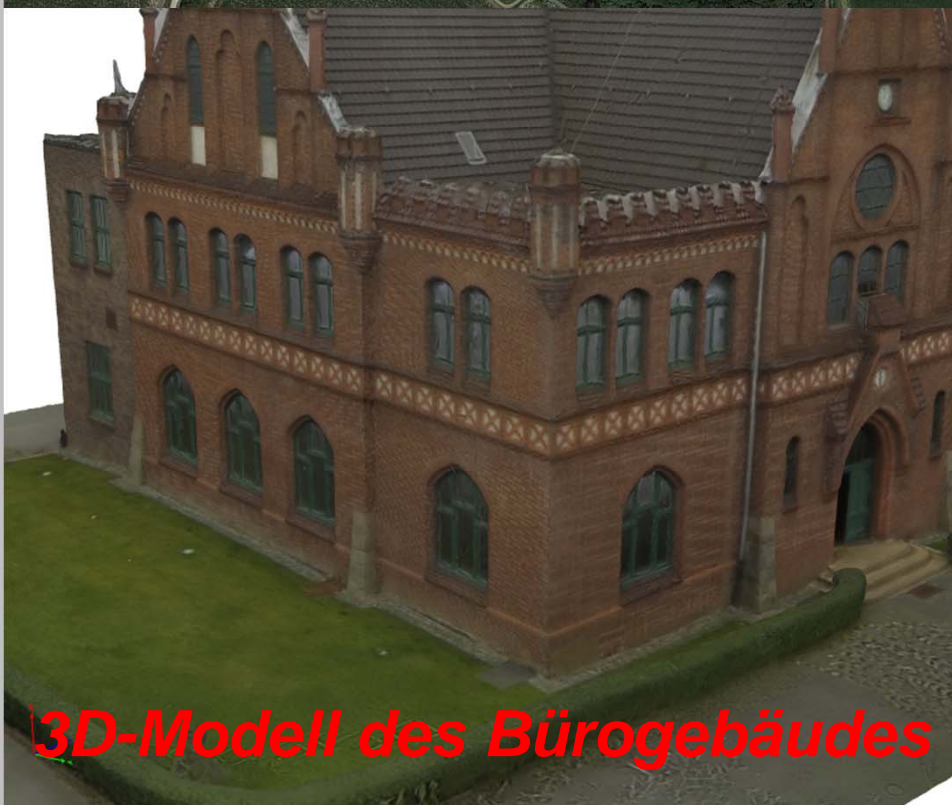
3D-Modell des Bürogebäudes