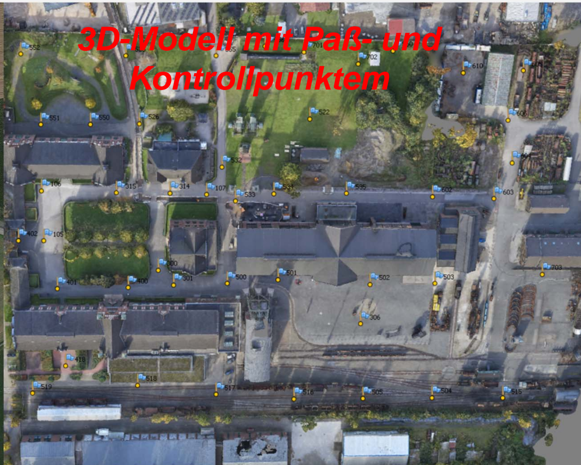
3D-Modell mit Paß- und Kontrollpunktem